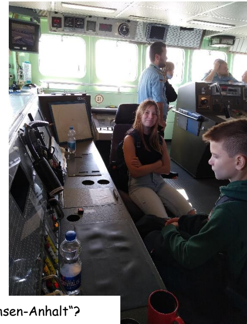
Wer sitzt denn da am Steuer der Fregatte „Sachsen-Anhalt“?