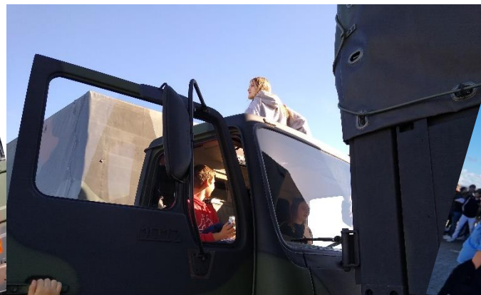
Neben der Marine waren auch das Heer und die Luftwaffe präsent.