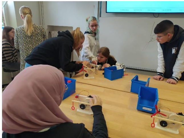
Die Mädels in ihrem Element!